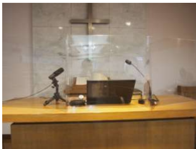
礼拝司式者の前に飛沫防止パネルを設置しています