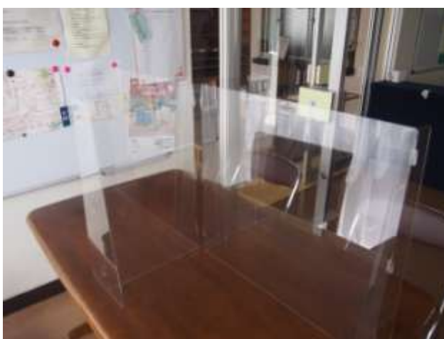
テーブルには飛沫防止パネルを設置しています