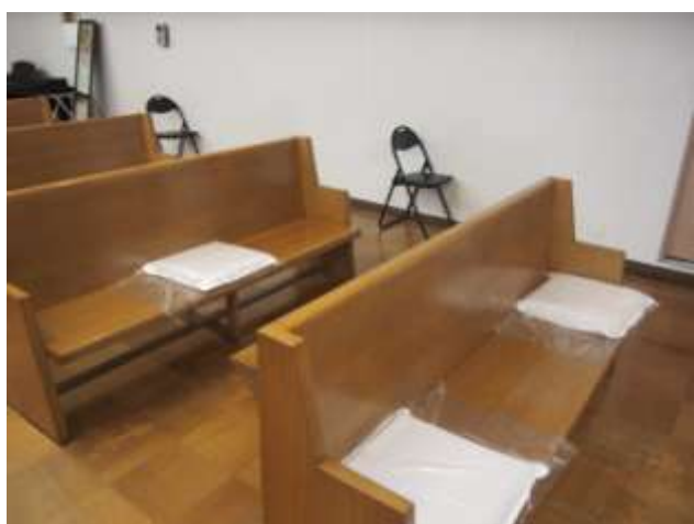
座席の間隔を十分に取っています